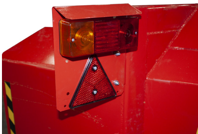
TURVALLISUUTTA LISÄÄVÄT VALOT